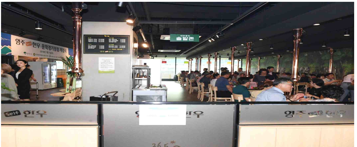
2층 영주한우 전문식당