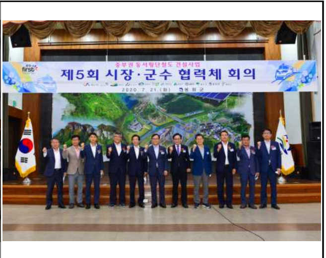
<제5회 시장·군수 협력체 회의 >