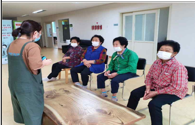
< 알레르기 다스리기 예방관리교육(성인) >