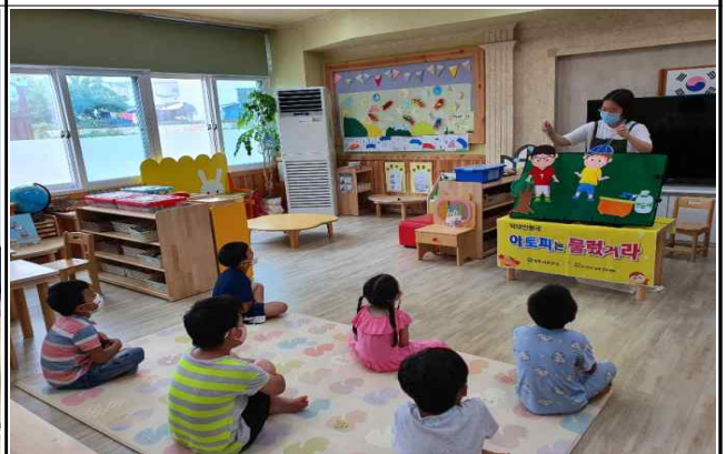
< 아토피 예방관리 교육(어린이) >