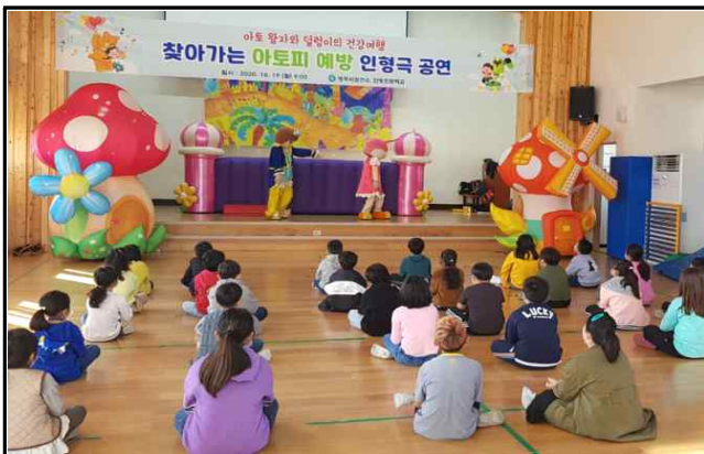
< 찾아가는 아토피 예방관리 인형극 공연 >