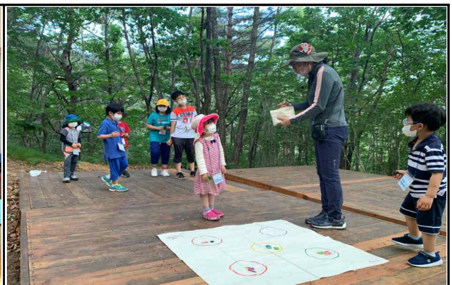
< 지역사회와 함께하는 숲-체험 건강캠프 >