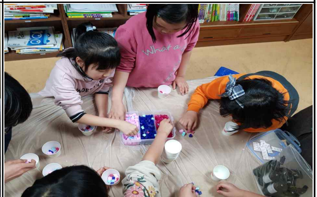
< 지역아동센터 천연비누 만들기 수업 >